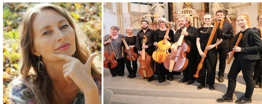
Fotorechte: Oksana Pavlychko, St. Thomas Consort Horn Astrid